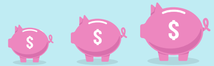
Out-of-network dentist Premier dentist PPO dentist

You may visit any network dentist, but you will save the most money by visiting a PPO dentist.